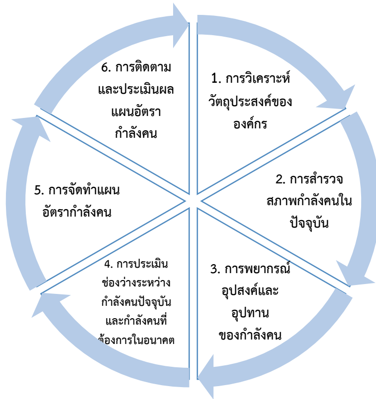
รูปที่ 1 ขั้นตอนการจัดทำแผนอัตรากำลังคน

ขั้นตอนการจัดทำแผนอัตรากำลังคน คณะนิติศาสตร์ ประกอบด้วยขั้นตอนหลัก ๆ 6 ขั้นตอน ดังนี้ ขั้นตอนที่ 1 การวิเคราะห์วัตถุประสงค์ขององค์กร (Analyzing Organization Objective)